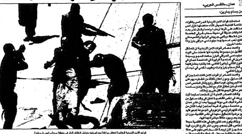
فرد الامن الأردني التماسه لاختصاصه مع اخطاه بعد اصابته بجراحات خطيرة في منطقة سحاب (بوترا)

عمان - القدس العربي: استناداً إلى ما ذكرته الجرائد الأردنية في وقت سابق من هذا الشهر، فإن اثنين من العصابة الذين تم اعتقالهم في الأردن، هما منفذو جريمة الرابية والشميساني. وقد تم اعتقالهم في وقت سابق من هذا الشهر. وقد تم اعتقالهم في وقت سابق من هذا الشهر.